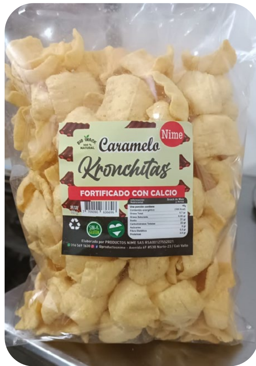
◆ Kronchitas Caramelo 220 gr