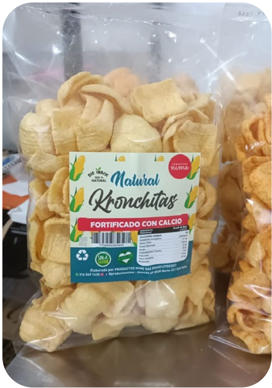
◆ Kronchitas Natural 220 gr