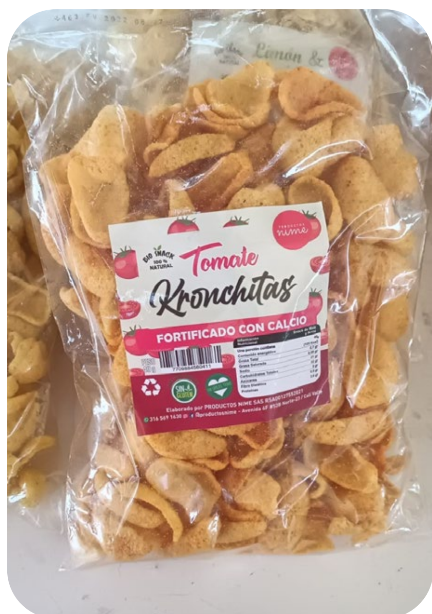
◆ Kronchitas Snack Tomate 40 gr