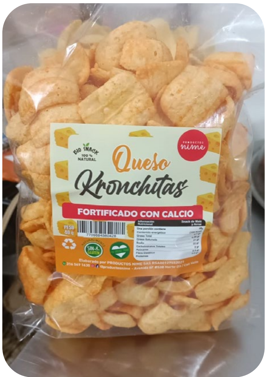
◆ Kronchitas Queso 220 gr