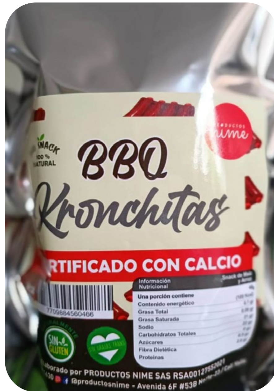
◆ Kronchitas BBQ 40 gr