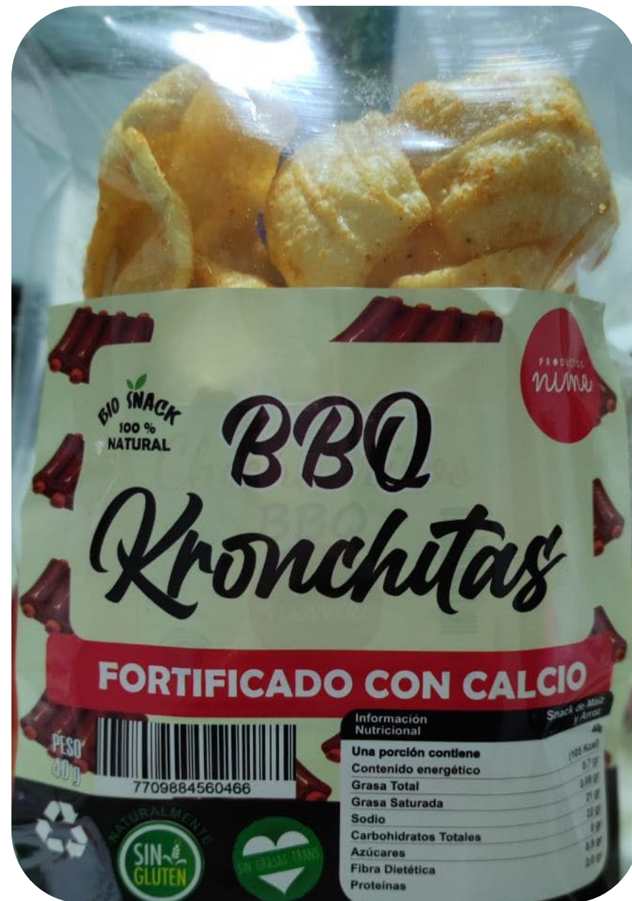
◆ Kronchitas Snack BBQ 30 gr