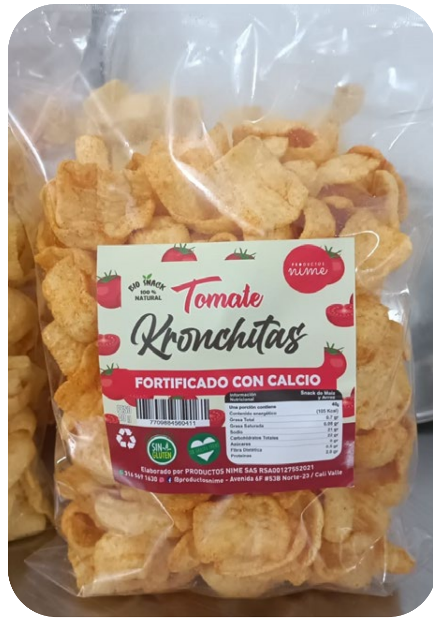
◆ Kronchitas Tomate 220 gr