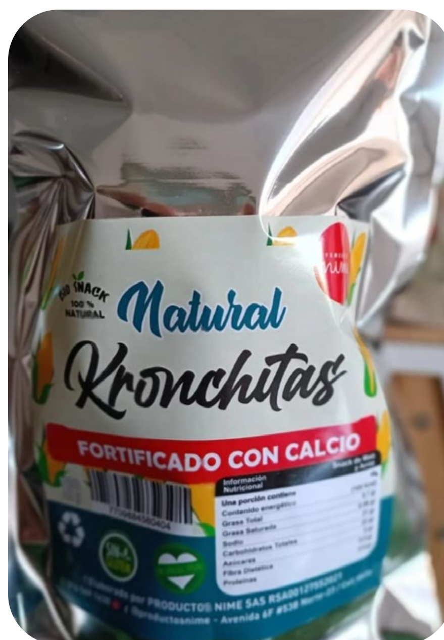
◆ Kronchitas Natural 40 gr