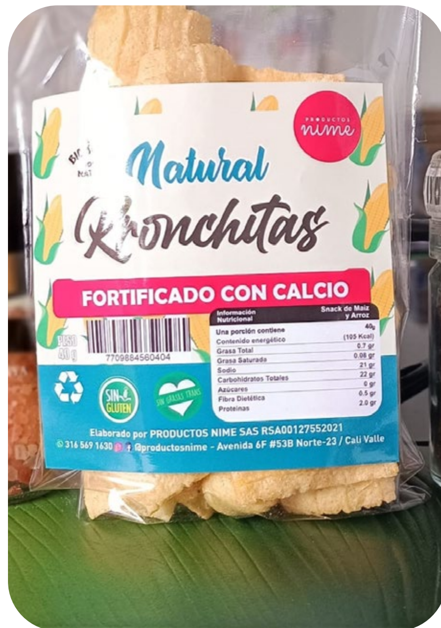
◆ Kronchitas Snack natural 30 gr