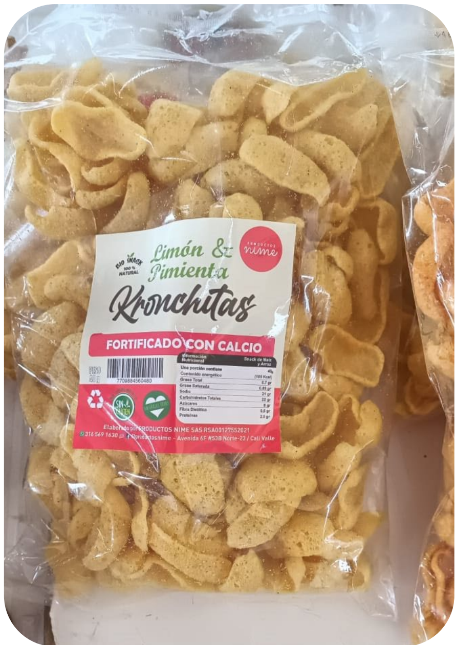
◆ Kronchitas Snack limón y pimienta 30 gr