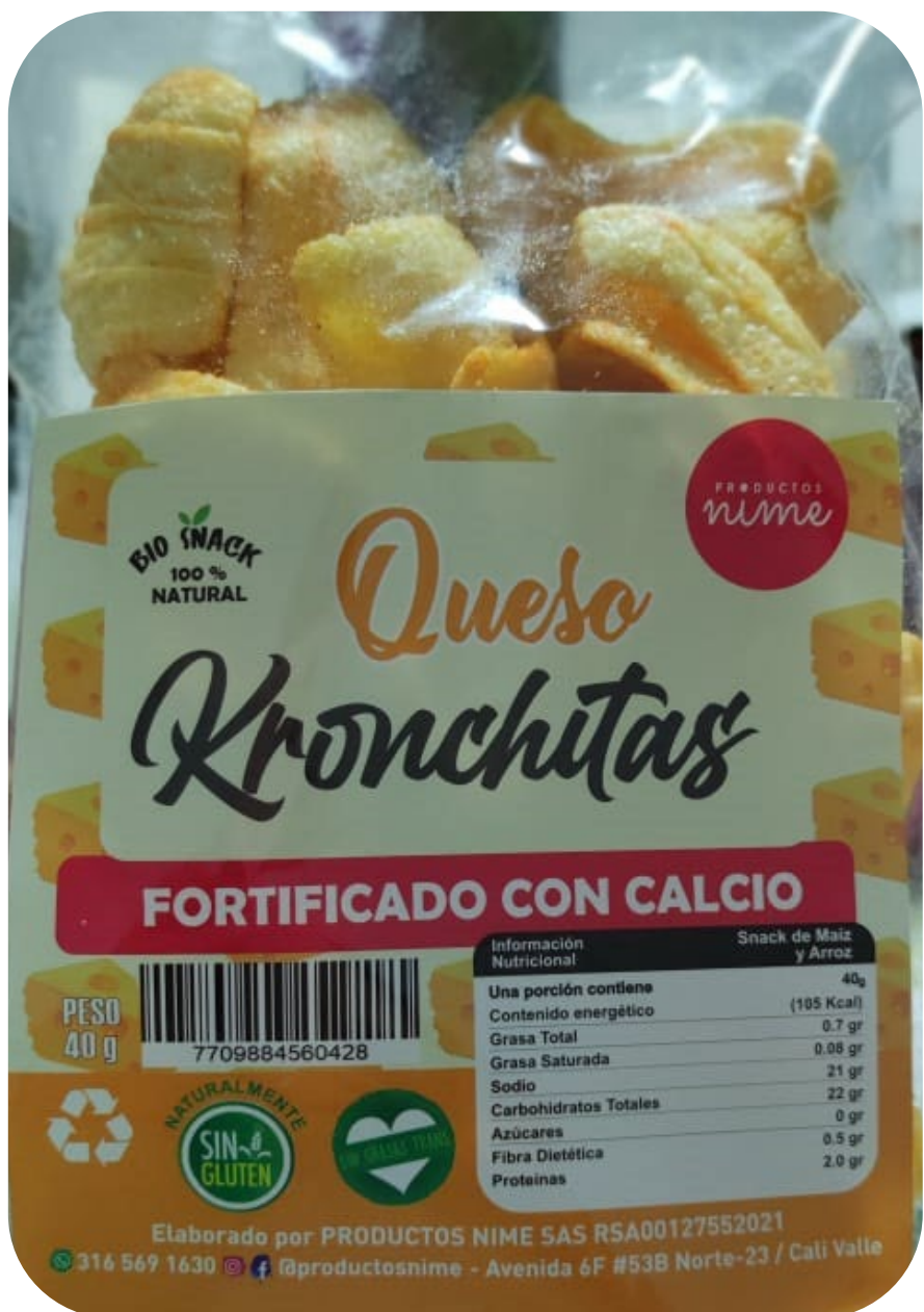
◆ Kronchitas Snack queso 30 gr