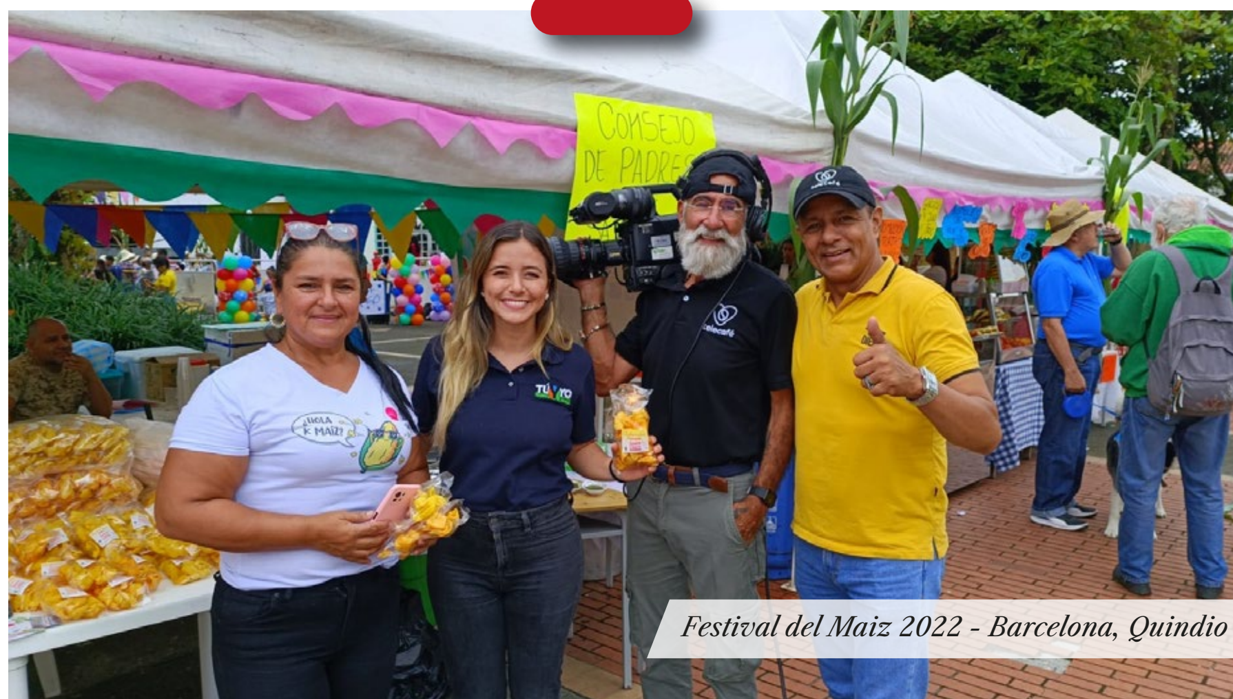
Festival del Maiz 2022 - Barcelona, Quindio