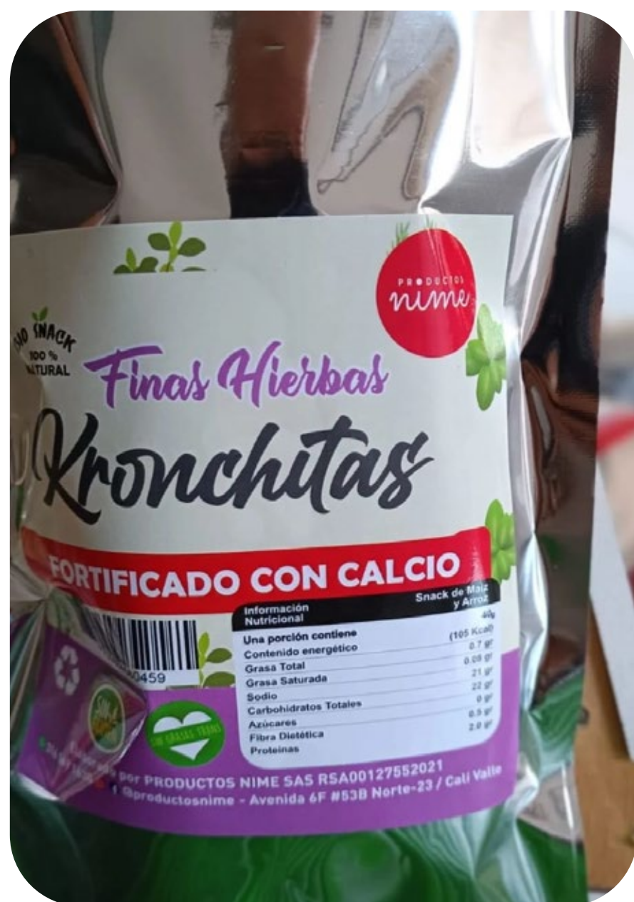
◆ Kronchitas Finas hierbas 40 gr