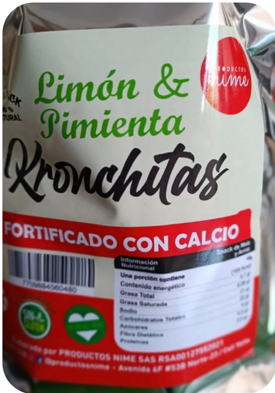
◆ Kronchitas Limón y pimienta 40 gr