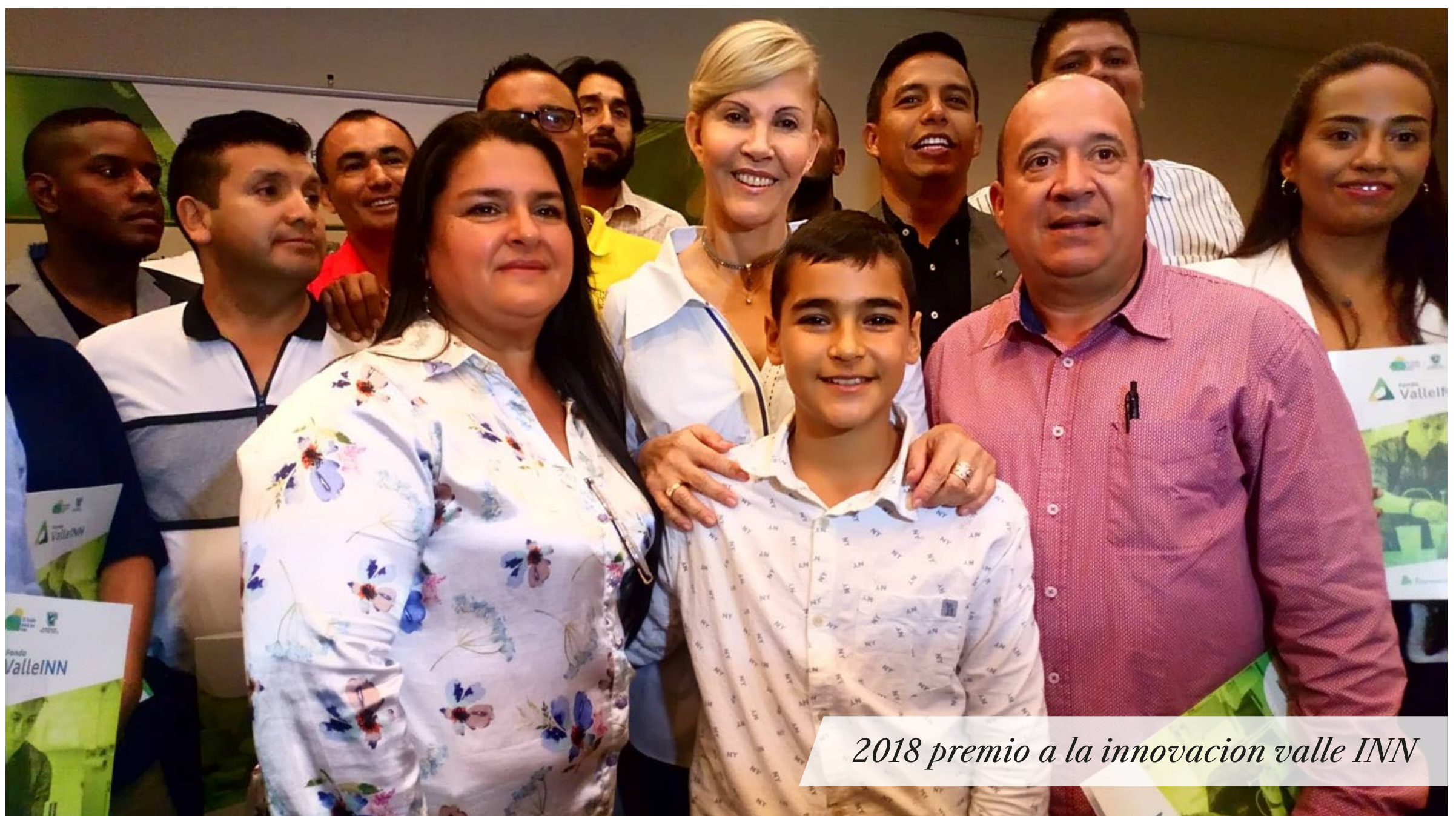
2018 premio a la innovación valle INN

Otorgado por la Gobernación del Valle del Cauca a los proyectos más innovadores