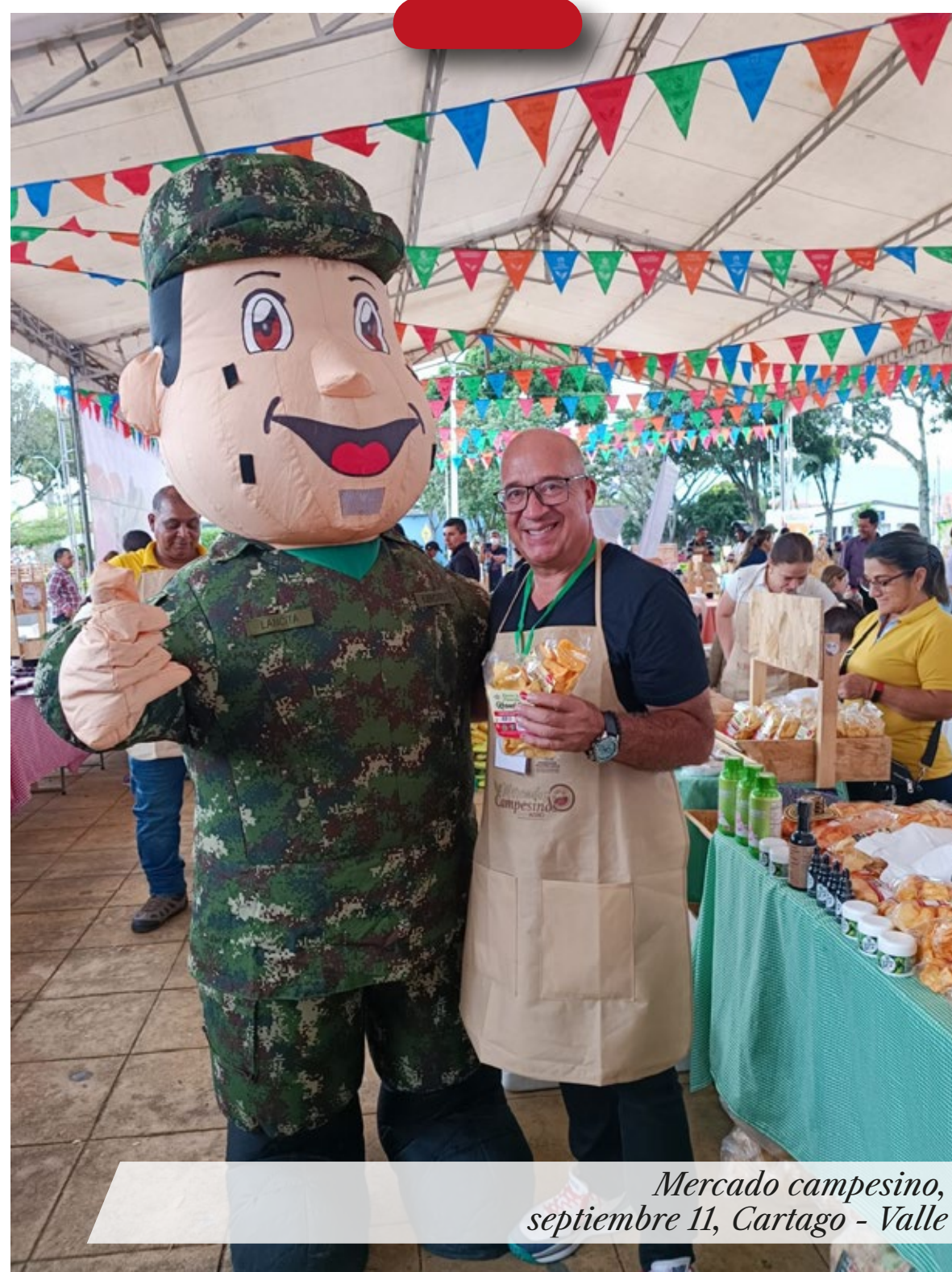
Mercado campesino, septiembre 11, Cartago - Valle