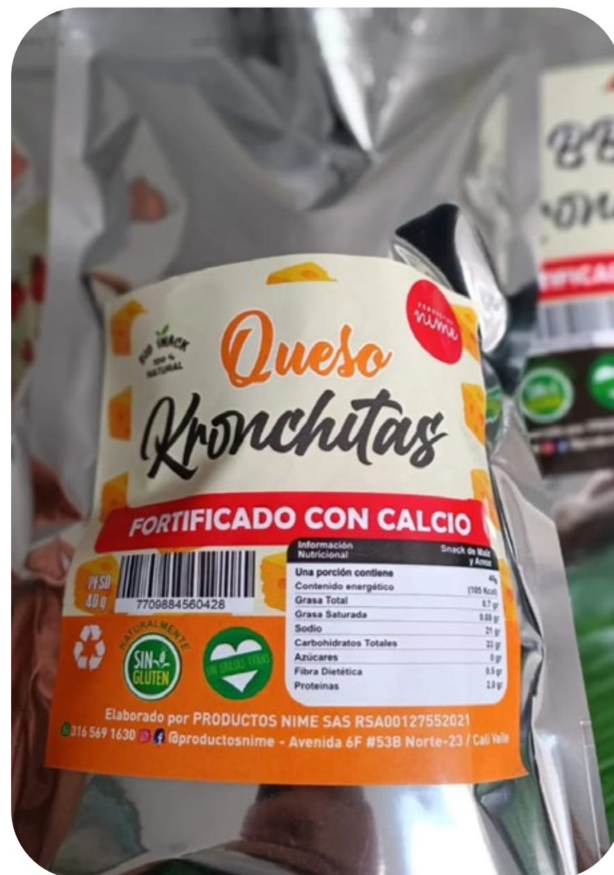
◆ Kronchitas Queso 40 gr