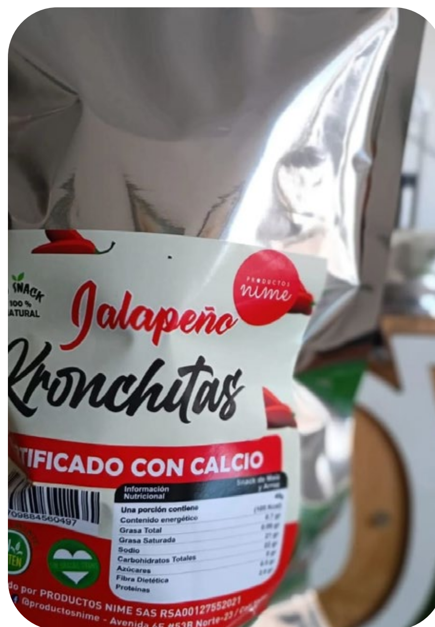
◆ Kronchitas Jalapeño 40 gr