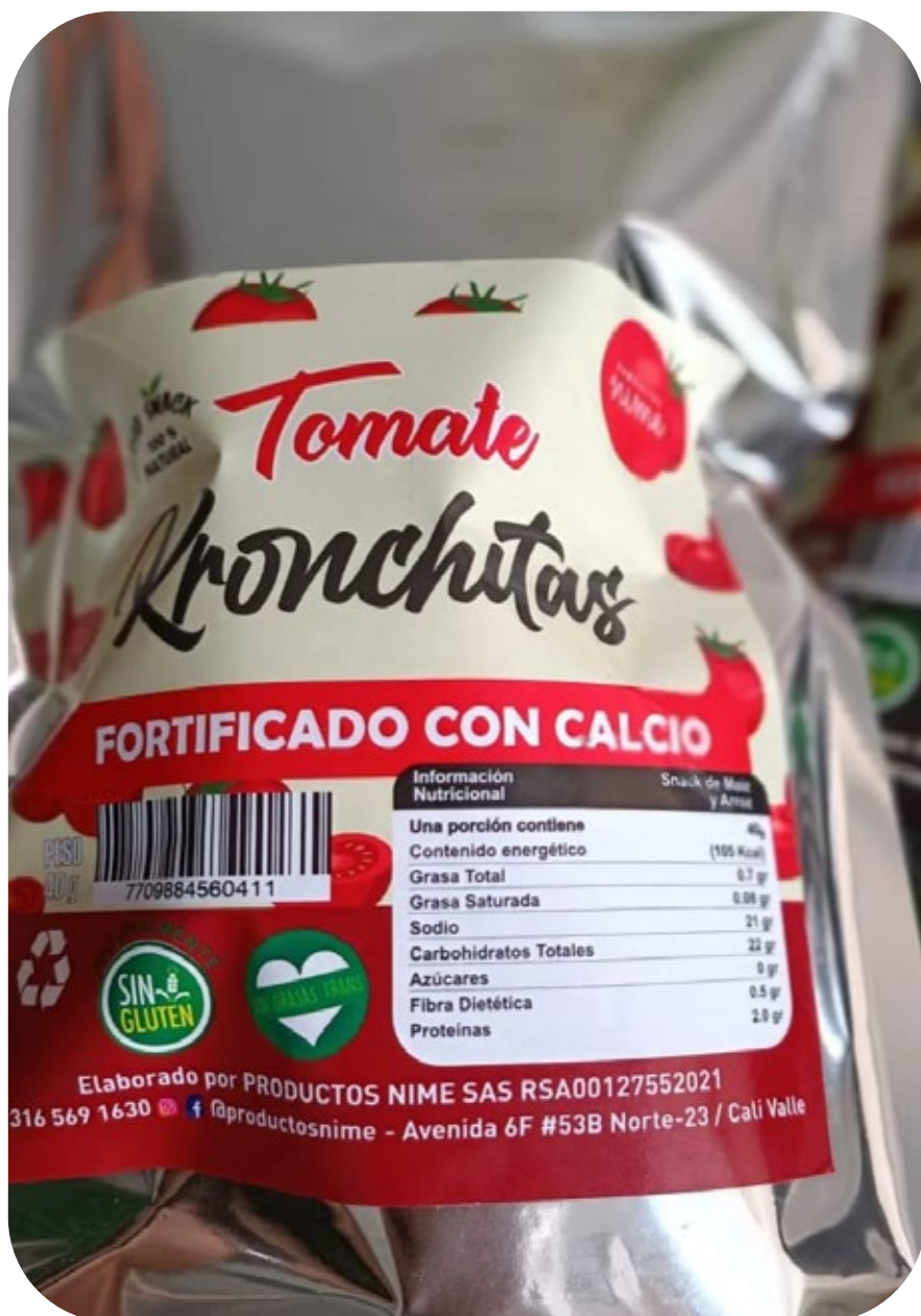
◆ Kronchitas Tomate 40 gr